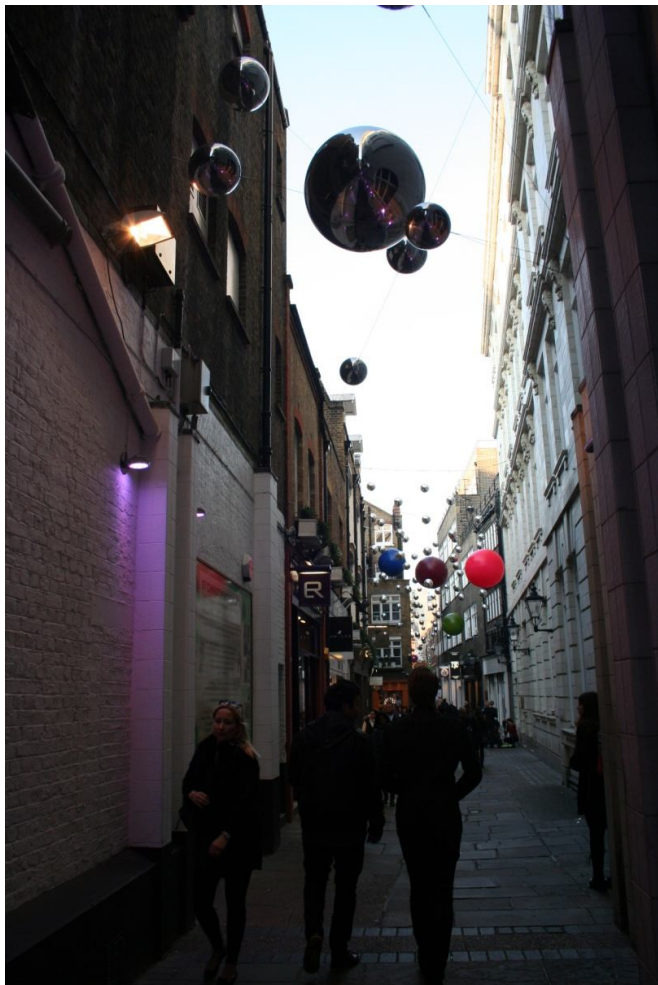
Ulica na Oxford Street

Po ogledu Muzeja naravne zgodovine smo odšli v trgovsko središče Oxford Street, ki je ima res veliko trgovin.