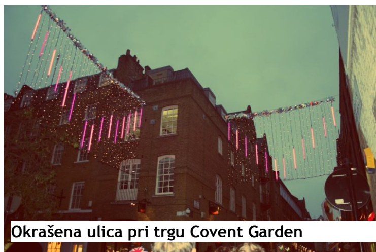
Okrašena ulica pri trgu Covent Garden

Po samostojnem ogledu muzeja smo se odpravili do trga Covent Garden, kjer so bile ulice že božično okrašene. Covent Garden je londonski trg, na katerem ima sedež istoimenska svetovno znana operna hiša Royal Opera House, ki si je na žalost nismo ogledali.