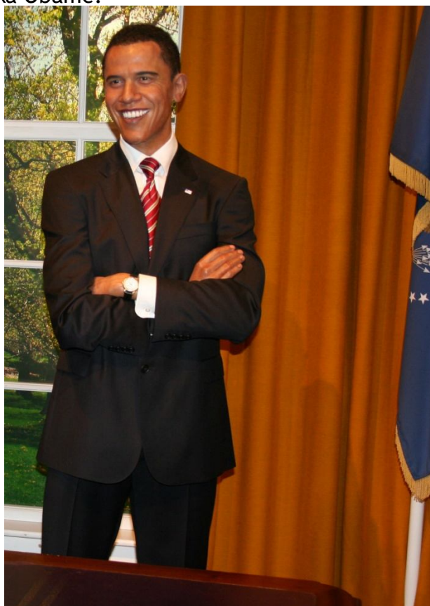
Madame Tussauds - lutki Marylin Monroe in Baracka Obame