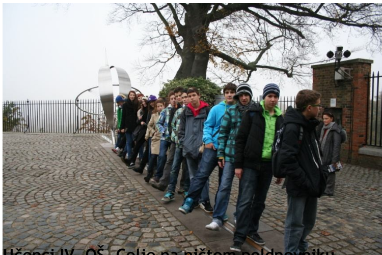
Učenci IV. OŠ. Celje na ničtem poldnevniku