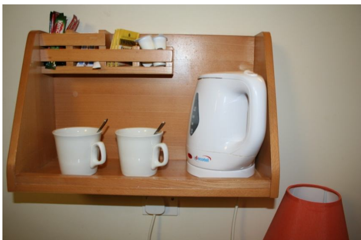
Vrelec za vodo, čaji in kavice