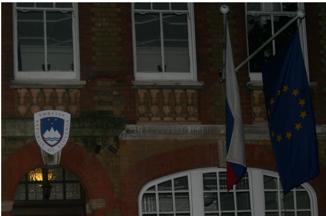
Veleposlaništvo Republike Slovenije v Londonu

Hitro smo se odpravili še do Veleposlaništva Republike Slovenije v Londonu (Embassy of Republic Slovenia), nato pa se vrnilo v hotel in odšli spat.