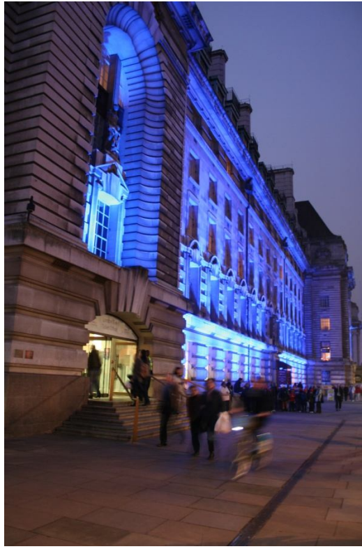
Ulica pri London Eyeu

Potovanje v London je bila moja najboljša odločitev in je nikoli ne bom obžalovala. Želim si pa, da bi imeli več časa, saj je ostalo še veliko znamenitosti, ki si jih nismo ogledali. Prepričana sem, da bom v London še šla.