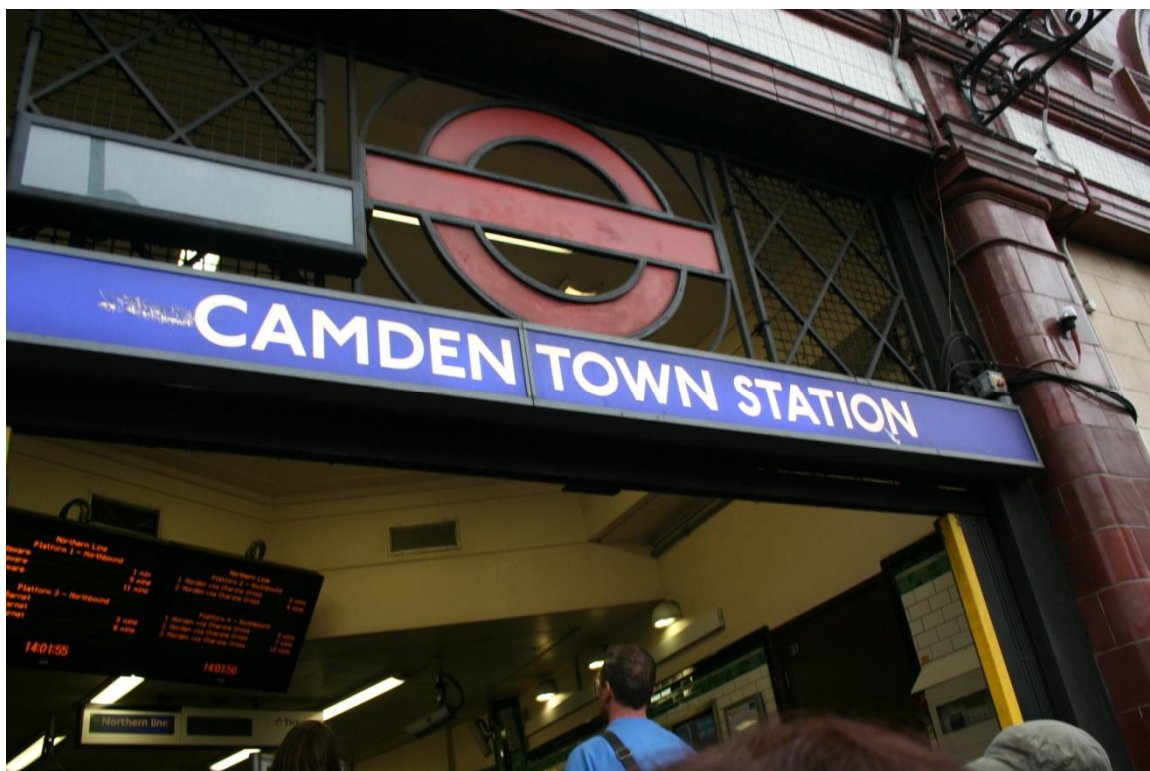
Podzemna postaja na Camden Townu