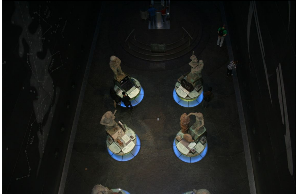
Natural History Museum